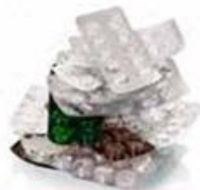
BLISTER PRVIDI MEDICINE