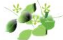
FIORI RECISI O APPASSITI