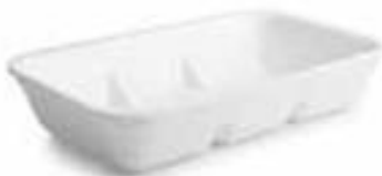
VASCHE TTE POLISTIROLO