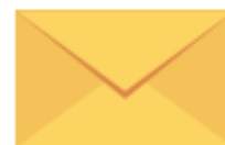
BUSTA DI CARTA