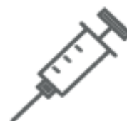
SIRINGHE (nel secco residuo)