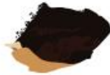
FONDI DI CAFFÈ