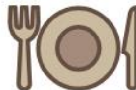
STOVIGLIE COMPUS TIBILI