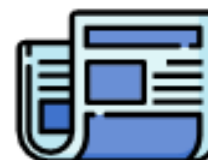
GIORNALI E RIVISTE