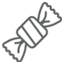
CARTA DELLE CARAMELLE (nella plastica)