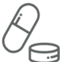
MEDICINALI SCADUTI (nei medicinali)