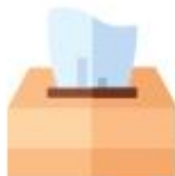
CARTA NON PATINATA, FAZZOLETTI E TOVAGLIOLI SPORCHI SOLO DI RESIDUI ORGANICI