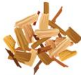
TRUCIOLI DI LEGNO