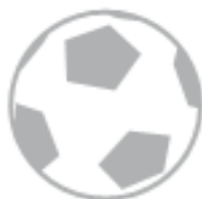
PALLONE (nel secco residuo)