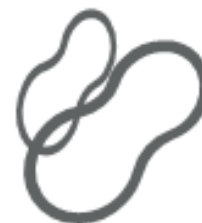
ELASTICI (nel secco residuo)