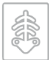
RADIOGRAFIE (nel secco residuo)