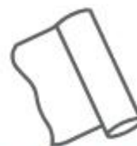
FOGLI DI ALLUMINIO