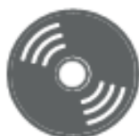
CD E DVD (nel secco residuo)