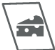
CARTA OLEATA (nel secco residuo)