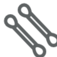
COTTON FIOC (nel secco residuo)