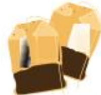
BUSTINE DI TÈ