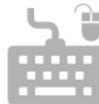
TASTIERA E MOUSE (RAEE)