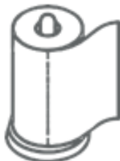
CARTA DA CUCINA (nel secco residuo)