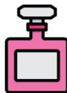
BOCCETTE PER PROFUMO