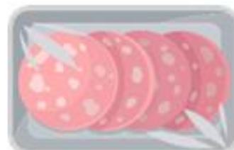
VASCHE TTE AFFETTATI