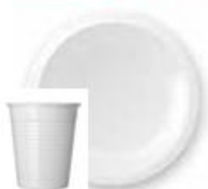
PIATTI E BICCHIERI MONOUSO