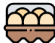
CARTONE DELLE UOVA