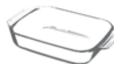
PIROFILE (nel secco residuo)