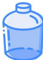
DAMIGIANA (senza involucro esterno)