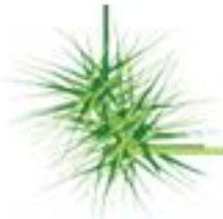
POTATURE DI PIANTE