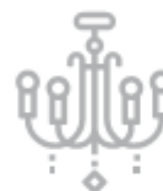
LAMPADARIO IN CRISTALLO (ingombranti)