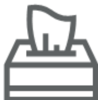
FAZZOLETTI PER IL NASO E CARTA ASSORBENTE (nel secco residuo)