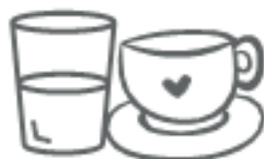
OGGETTI IN CERAMICA VETRO (nel secco residuo)