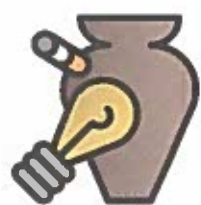
TABELLA DI CONFERIMENTO DEI RIFIUTI